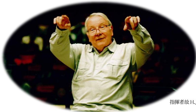
指揮者故 H.J. ロッチュ氏の提唱で始められました。

14年間で1200万円以上の募金により350台の車椅子を贈り、約150台の車椅子を修理しました。