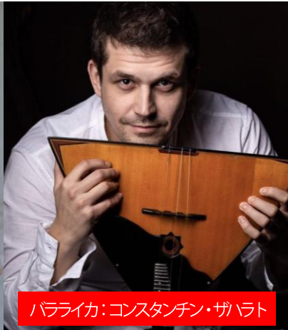
バラライカ:コンスタンチン・ザハラト